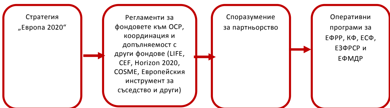
Схема 1: Рамка на програмирането на фондовете към ОСР за 2014 - 2020 г.

През 2011 г. Европейската комисия (ЕК) изготви и предложи за обсъждане проект на Регламент относно общо-приложимите разпоредби Европейския фонд за регионално развитие (ЕФРР), Европейския социален фонд (ЕСФ) и Кохезионния фонд (КФ), Европейския земеделски фонд за развитие на селските райони (ЕЗФРСР) и Европейският фонд за морско дело и рибарство (ЕФМДР). Проектът на Регламент (наричан отгук нататък за краткост „Общ регламент“) обхваща програмен период 2014 – 2020 г.